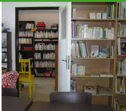
Pohled na upravenou knihovnu, 7/2014